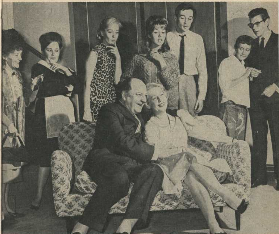
Les interprètes de la comédie de Michel Fermaud "LES PORTES CLAQUENT"