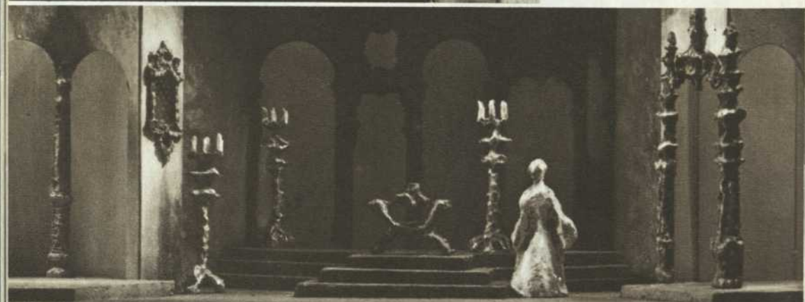
Maquette du décor