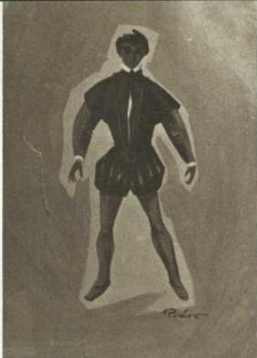
Dino Del Moro