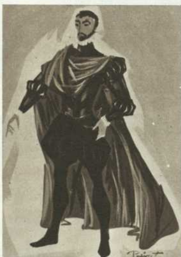
Le Grand Admiral et Prince de la Mer